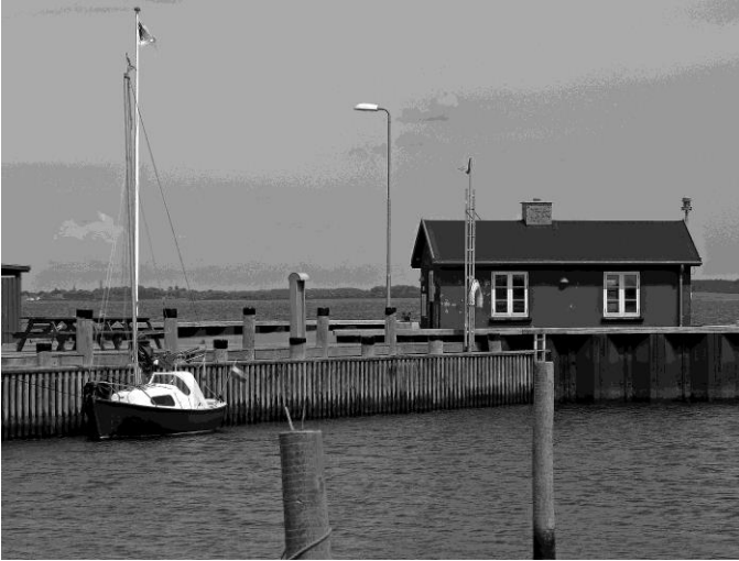
'Kleinkapitalist' in haven Strynø met 'sejlersstue'

goed laveren en lukt het me om de snelheid op 4 knoop te houden. Het laatste stukje moet op de motor; voor de brug is er een smalle geul tussen ondieptes van een halve meter en na de brug neemt de wind sterk af en wordt het weer zo druilerig dat ik het zeilen maar voor gezien houd.