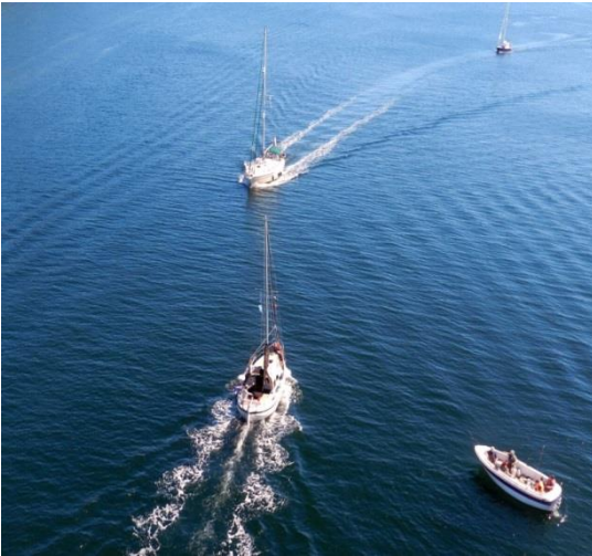
De 'Razzle Dazzle' links onder, gefotografeerd vanaf de hoge brug

Ook ziet u ons op de foto die vanaf de hoge brug (plm. 60ft AMSL) is gemaakt door Niko van Schaik van de 'Above Mean Sea Level'. Wat een prachtig land is dit toch. Jammer dat je er vanuit Nederland zo'n drie dagen over doet om er te komen. 'Effe' naar Farsund in een vrij weekeindje is wat teveel van het goede.