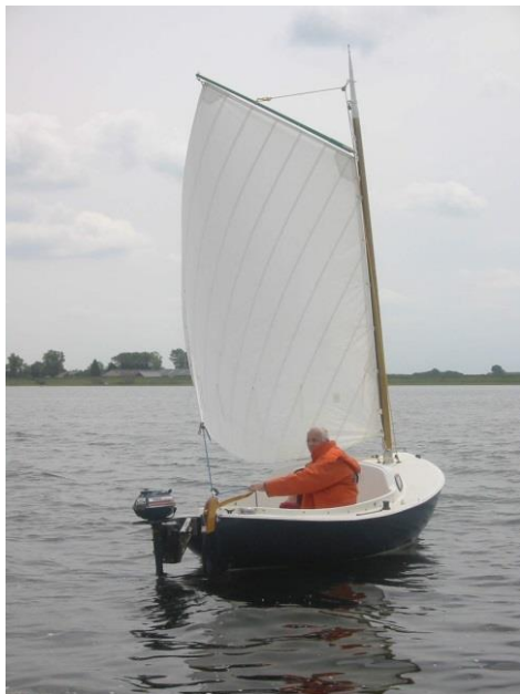
Op het Veerse Meer

In Spitsgattertje 143 (dec. 2012) schreef ik over het 'omcatten' van mijn Midget 15. Hoewel ik nog steeds aan het werk ben aan mijn oude huis in Middelburg heb ik toch al gezeild. Het cattuig bevalt erg goed. De boot is wat ondertuigd, want het zeiltje is 5,5 m 2 maar door de grote bolling - er wordt gezeild zonder giek - trekt het erg goed, maar niet hoog aan de wind. Omdat ik wat spelebaar op het Veerse Meer (Kortgene) is het er breed genoeg om niet te hoeven prikken. Het zeiltje is erg handzaam met alleen maar een gaffeltje (top van een surfmast). Dat gaffeltje past net in de kajuit, met het zeiltje eenmaal dubbel gevouwen en dan opgerold.