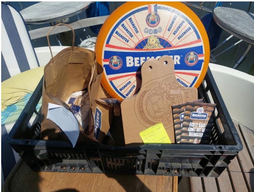
Onze sponsor

het laatst? Onder de oude bekenden overwegen een tweetal bemanningen de bakens te verzetten door de zeilen in te ruilen. Om 16.30 was de (inmiddels traditionele) steigerborrel met Friese worst en Beemsterkaas. (De kaas EN de sponsoring van dit bedrijf hadden we te danken aan een familielid van Willy Arjaans die bij Beemsterkaas werkt, dus dat was een mooie geste).