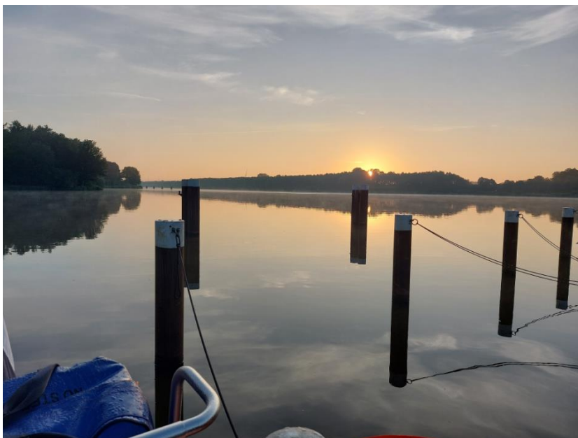
Zonsopgang bij Dückerwisch in het Kielerkanaal, gezien vanaf de aanlegplek

Vóór 07.00 uur varen we uit en kunnen gelijk op zeil richting Holtenau aan het begin van het Kielerkanaal. We varen langs grote driemasters en deels door meerdere zeilwedstrijden, want het is Kielerwoche ('Sneekweek 2x in het kwadraat'). De sluis voor recreatievaart is gestremd, maar we kunnen vlot achter een containerschip mee in de sluis voor beroepsvaart, dus weinig wachttijd. Dat is wel belangrijk, want de tocht is lang, en je mag alleen met daglicht varen in het Kielerkanaal. Zonsondergang is om 22.00 uur, er zijn ligplaatsen aan het Gieselaukanaal, maar dan is het nog 22 mijl naar de sluis bij Brunsbüttel. Met vertrek gelijk na zonsopgang de volgende dag, kunnen we 3 á 4 uur na hoogwater bij de sluis zijn, maar dat wordt wel krap.