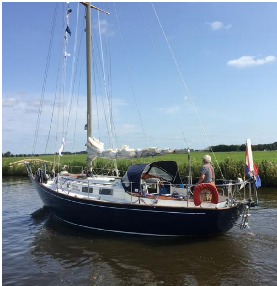
'Johanna Hendrika' van Tjeerd Boersma van Woudsend naar Langweer