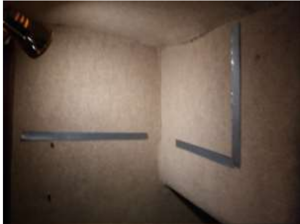
Passen en meten: hondenkooi stuurboordkant

Het werd tijd om een deskundige te raadplegen en de ideeën te toetsen aan de haalbaarheid ervan. Daarvoor gingen wij te rade bij de Gier Jachtservice in Enkhuizen, bij ons om de hoek. De conclusie was dat het haalbaar was, waarbij er wel enige onzekerheid was over de loop van de diverse bedradingen. Maar technisch was het haalbaar en het had geen gevolgen voor de motorruimte noch voor de algehele constructie van de boot. De kwaliteit van een Midget is uiteraard geweldig. Er kwam een offerte en op basis daarvan een overeenkomst. De boot ging het water uit en de hal in. De werkzaamheden konden beginnen. Het fijne van dit bedrijf was, dat ik mocht komen kijken zo vaak ik wilde. Meestal waren er dan ook nog wel wat aanpassingen te bespreken.