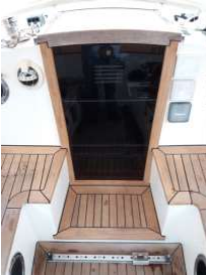
De nieuwe situatie