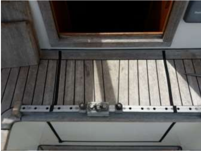
De rail van bovenaf gezien

Een probleem was nog wel de rail van de overloop. Dat hebben wij opgevangen door de rail ca.10 cm verder naar achteren op de bodem van de kuip te maken. Prima te doen, maar het betekende wel enige concessie aan de effectiviteit van de rail. De grootschoot kan minder ver naar buiten worden gezet. Achteraf had ik mij wellicht wat meer moeten verdiepingen in alternatieven zoals German Sheeting of anderszins.