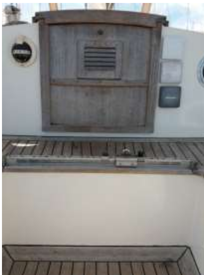
De oude situatie

Maar met het verstrijken van de tijd ging iets ons tegenstaan. Als je per dag vele keren van binnen naar buiten gaat, heb je elke keer de hindernis van het hoge brugdek te nemen. Op een bepaald moment ging ik dat voelen in mijn rug. Ik begon er tegenop te zien om van buiten naar binnen te gaan of omgekeerd. Je moet namelijk tegelijk omhoog voor het brugdek als wel omlaag om onder de buiskap door te kunnen. Het was eigenlijk al zover, dat wij hebben overwogen een ander schip te gaan aanschaffen en dan wellicht ook helemaal over te gaan op een motorboot. Maar het onverteerbare idee dat ik niet meer zou kunnen zeilen was de reden dat wij ons afvroegen of er ook iets aan dit probleem te doen zou zijn. Zou dat brugdek misschien te verlagen zijn? We wilden ook helemaal niet van onze Midget af.