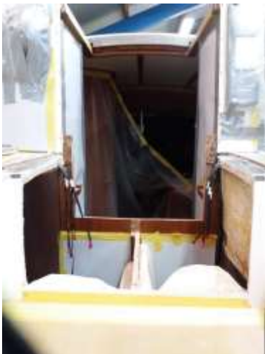
De zaag er in

Een probleem was nog wel de rail van de overloop. Dat hebben wij opgevangen door de rail ca.10 cm verder naar achteren op de bodem van de kuip te maken. Prima te doen, maar het betekende wel enige concessie aan de effectiviteit van de rail. De grootschoot kan minder ver naar buiten worden gezet. Achteraf had ik mij wellicht wat meer moeten verdiepingen in alternatieven zoals German Sheeting of anderszins.