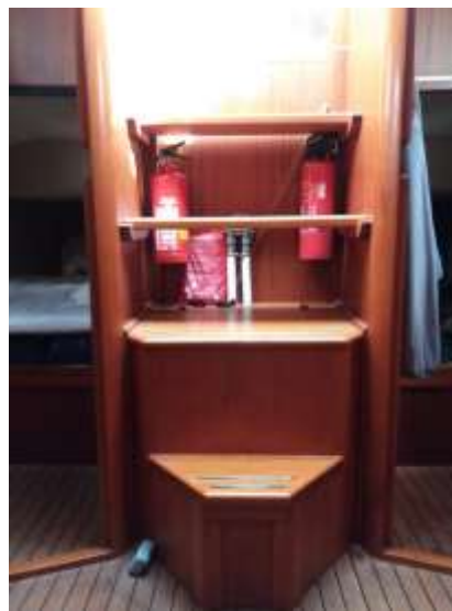
Oude situatie van binnenuit

Ik ben toen gaan meten, meten en nog vele malen meten. Ook ging ik in de kooi liggen om te kijken wat de verlaging in werkelijkheid zou betekenen voor het slaapcomfort. Ik kwam tot de slotsom dat het feitelijk een loze ruimte was en dat als dat plafond lager zou zijn, het op geen enkele manier hinderlijk zou zijn.